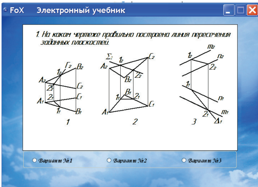
Рис. 2. Фрагменты обучающей программы. Пример теста.

Так как автоматизированный обучающий курс планируется использовать в основном для самостоятельной работы студента, основными критериями создания предлагаемого автоматизированного учебно-методического комплекса дисциплины начертательная геометрия являются: четкость, и краткость изложения теоретической части, иллюстрированный графический материал.